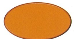
●ライン用イエロー