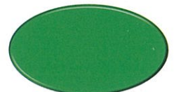
No.21 エメラルドグリーン